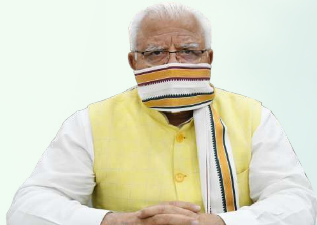
श्री मनोहर लाल, मुख्यमंत्री, हरियाणा